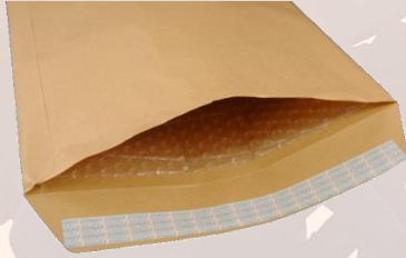
KİMLİK ZARFI EK-1 ve EK-2