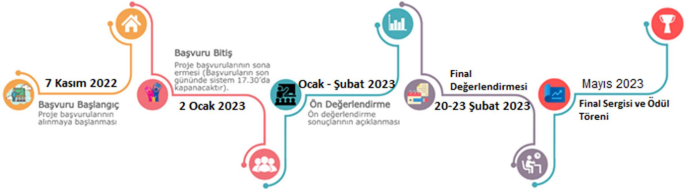
Şekil 2: Yarışma Takvimi